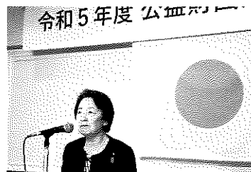
山谷えり子参議院議員の挨拶