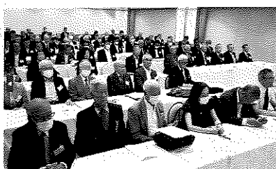
総会に参集された会員