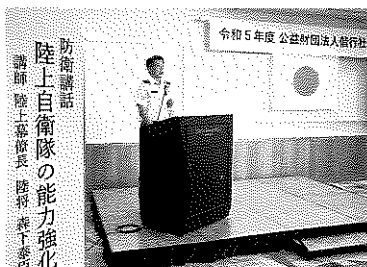
防衛講話 陸上自衛隊の能力強化 演題「陸上自衛隊の能力強化」 講師 陸上幕僚長 陸将 森下泰臣