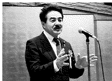
会員を代表して祝辞を述べられる佐藤正久参議院議員