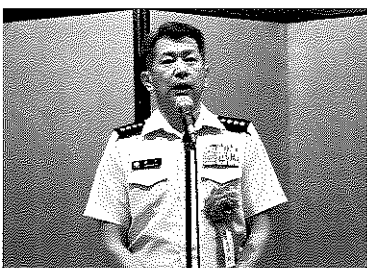
現職を代表して祝辞を述べられる森下泰臣陸幕長