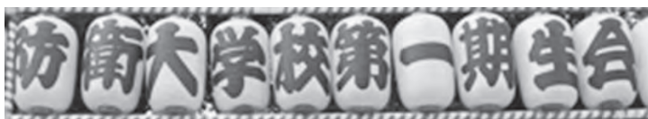
陸士期別毎と防大1期生会の献灯