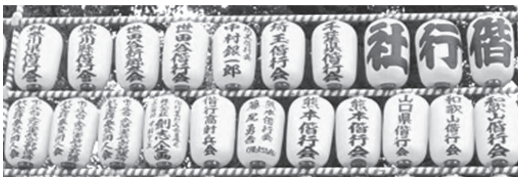
（陸修）偕行社と各地偕行会の献灯

靖國神社境内には大小3万を超える献灯（みあかし）や各界名士の揮毫による懸雪洞（かけぼんぼり）が掲げられ、九段の夜空を美しく彩りました。本殿では毎夜、英霊を慰める祭儀が執り行われました。